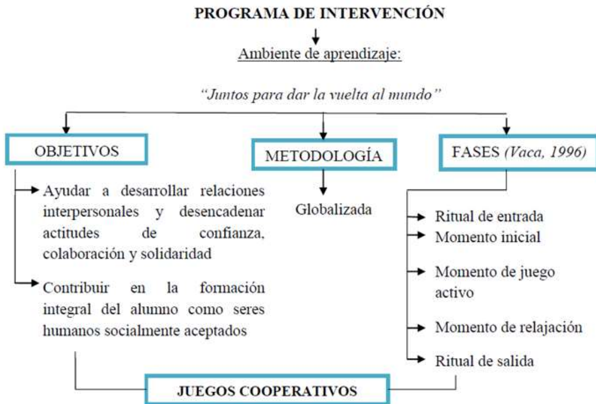
Figura 2. Esquema general de la propuesta didáctica.

El esquema general de la propuesta didáctica puede verse en la Figura 2. El programa de intervención gira en torno a través de una temática común, siendo esta “Juntos para dar la vuelta al mundo” . Todo se vertebra a raíz de los ambientes de aprendizaje, tal y como justifica Blández (2000) en su propuesta de Unidades Didácticas. Por este motivo, la metodología utilizada ha sido globalizada, es decir, las actividades que se han propuesto en la fase de actividad motriz no se presentan aisladas, sino que son una continuación del contenido visto en el aula, con la finalidad de desarrollar un conjunto de capacidades en las distintas dimensiones de conocimiento, valores y actitudes del alumnado a través de diversas herramientas para su desarrollo integral (Gil, 2013). Es por ello que a través de las actividades propuestas (trabajo por proyectos, centros de interés, rincones, etc.) se ha querido trabajar de forma global y no mediante parcelación del conocimiento (motor, perceptivo, afectivo, relacional, social y cognitivo). Un ejemplo de estas actividades es el cuento motor, siendo este un cuento narrado y jugado, con características y objetivos propios, que se utiliza como recurso